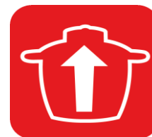
BOL XL 4,8 L jusqu'à 16 personnes