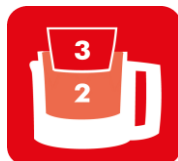
BOLS 3 EN 1