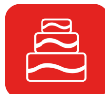
PÂTISSIER XL jusqu'à 16 parts